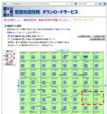
圖-3 地形數據輸入：國土地院網頁 ( http://www.gsi.go.jp ) 之地形數據下載畫面

這樣的設計，使用人不需另外學習地理座標系統知識，就能很容易學會操作程序。此外，因為使用者操作程序大幅減少，整體操作更快速，也不易操作錯誤。