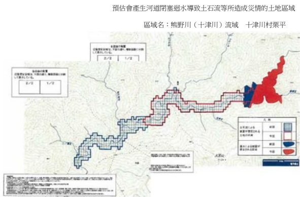
圖-4 栗平地區土石流氾濫預估區域。國土交通省 2011 年 9 月 12 日記者會發表資料。藍色網格為 9 月 8 日所發表區域，紅色網格為 9 月 12 日更新之區域。圖顯示在電子國土上。