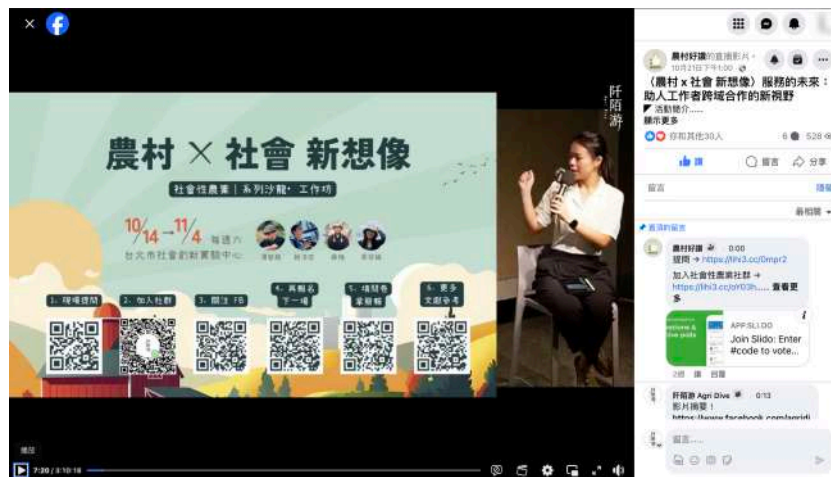
圖 三-6 第二場線上直播畫面示意圖

(八) 農村好讚臉書粉專直播紀錄，至期末報告書撰寫時已 528 觀看次數，如圖 三-6。