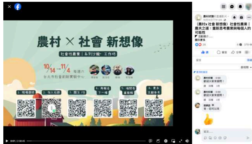
圖 三-3 第一場線上直播畫面示意圖

(八) 農村好讚臉書粉專直播紀錄，至期末報告書撰寫時已 379 觀看次數，如圖 三-3。