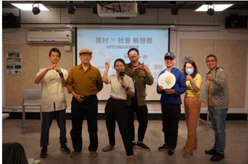
圖 三-5 第二場主題沙龍合照