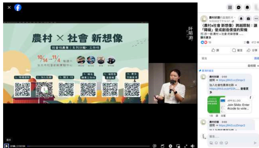
圖 三-9 第二場線上直播畫面示意圖

(八) 農村好讚臉書粉專直播紀錄，至期末報告書撰寫時已 412 觀看次數，如圖。