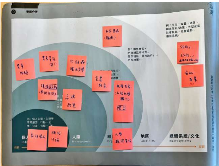
圖 三-14 農場（農民）角色的資源地圖