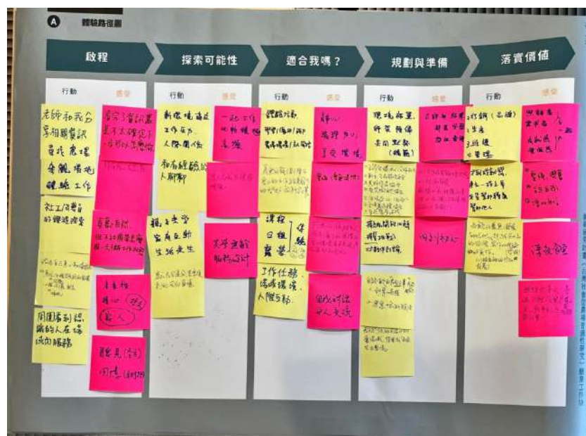
圖 三-15 特殊需求族群角色的體驗路徑圖