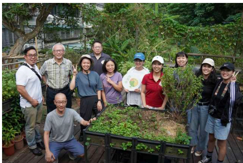
圖 三-11 願景工作坊參與者合照