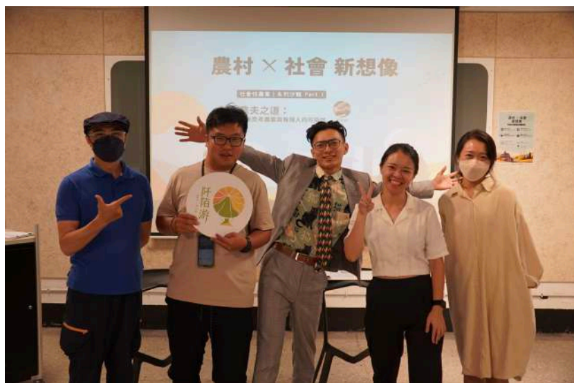
圖 三-2 第一場主題沙龍合照