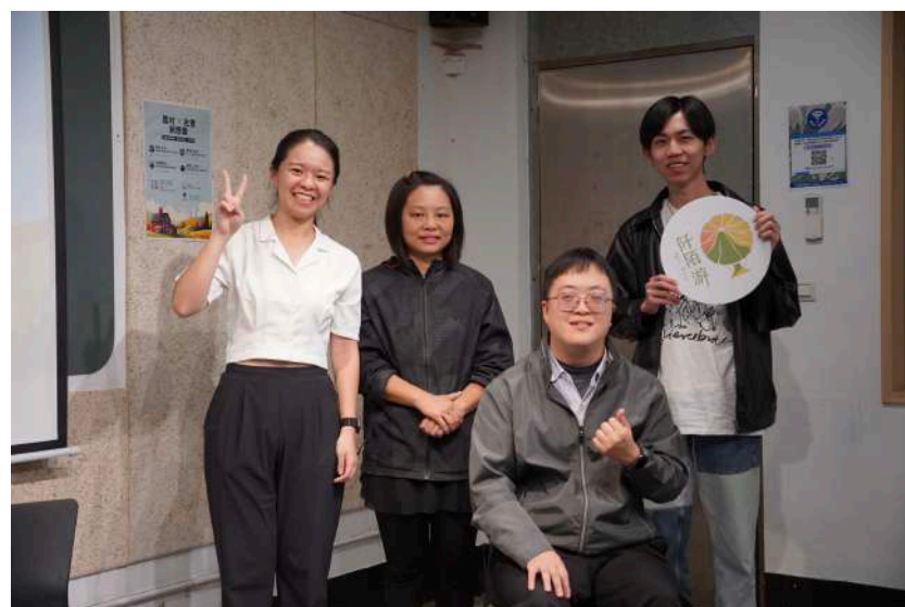
圖 三-8 第三場主題沙龍合照