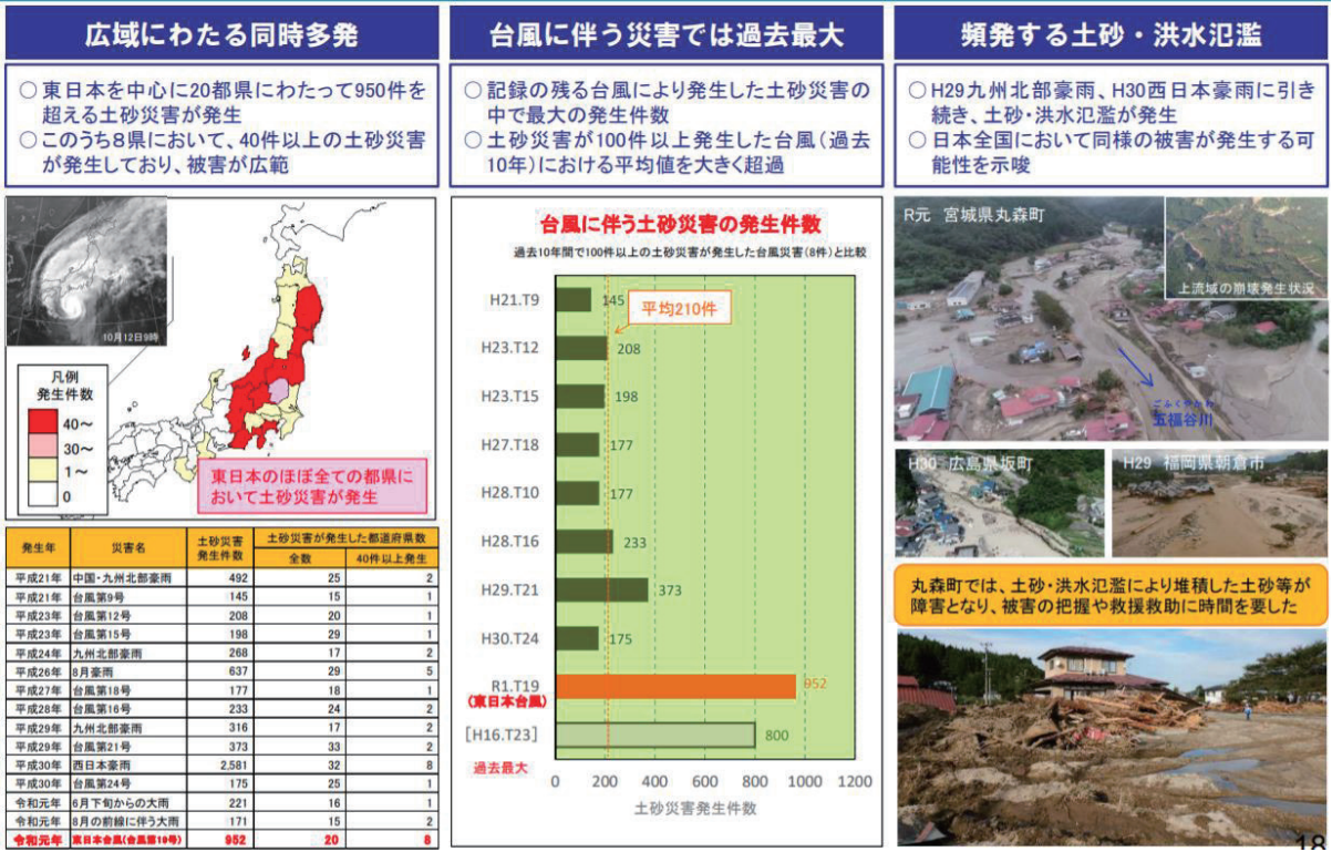
圖 2 日本近年土砂災害特徵(國土交通省，2019)

日本近年來連續發生多起重大水災及土砂災情後，相關單位已針對近期土砂災害特徵及氣候變遷下土砂防災對策密集研商，並提出相關調適策略與作法，圖 2 為近年來日本土砂災害特徵，包括：受災範圍廣且多處同時發生、颱風衍生的災害比過往事件大、土砂及洪水氾濫災害更加頻繁。本研究以文獻分析法針對所蒐集文獻內容有關氣候變遷對土砂影響等進行彙整，以瞭解目前氣候變遷下土砂防災領域所面臨之衝擊課題，綜整如表 2。