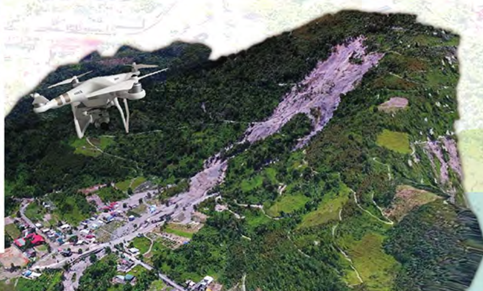
▲ 圖1、災後三維地形模型