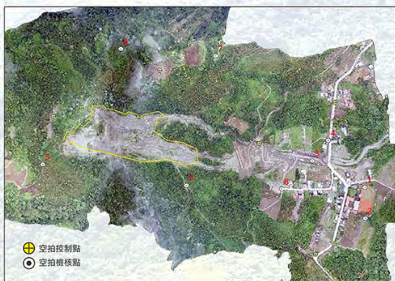
▲ 圖2、災後崩塌正射影像與崩塌範圍

崩塌屬於一種自然演化現象，是地形演育的必要作用，當人類活動範圍已擴及至較高海拔時，常面臨崩塌所帶來的災害威脅及恐懼。因此，藉由以往已發生之崩塌案例，分析其地理特性、地質條件、災害影響範圍等，不僅可瞭解崩塌地之災害承受差異性，亦可供後續崩塌防災策略研擬之參考。本研究以2016年9月15日臺東縣延平鄉紅葉村地區發生的崩塌事件為研究案例，利用遙測技術建立崩塌發生後之區域地表數值模型（Digital Surface Model, DSM），並以此成果與發生崩塌前之地表模型（Digital Elevation Model, DEM）進行比對，並推算此次崩塌事件所產生的土方量及地形變化量。